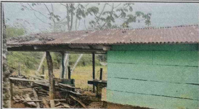
Foto 1: En esta fotografía se observa el estado actual de la cocina del establecimiento, se encuentra en malas condiciones y representa un riesgo alto a la integridad física de las que preparan la comida como la de