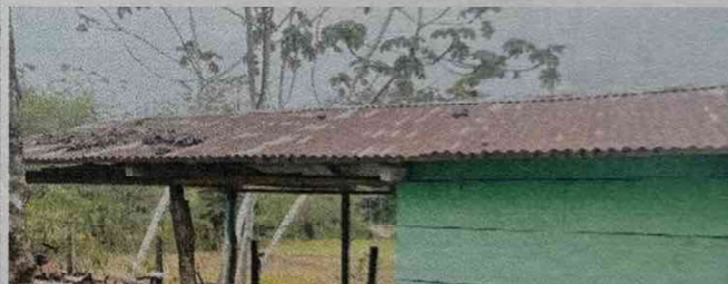
Foto 4: En la presente imagen se observa el deterioro grave del techo del establecimiento educativo, se cambiará el techo por la mala condición que presenta.