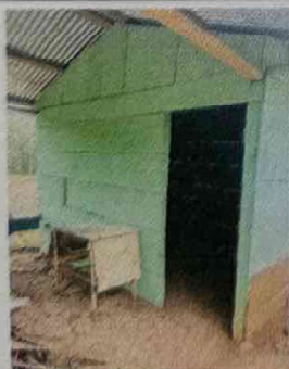
Foto 5: Se colocará piso cerámico ya que actualmente no cuenta con un piso adecuado para la cocina.