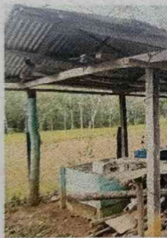
Foto 3: Cambio de columnas actuales madera por columnas de concreto.