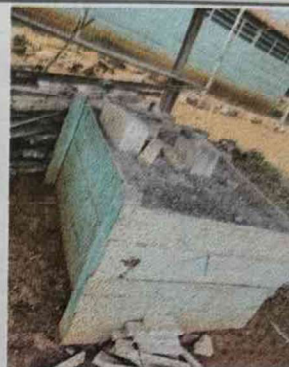
Foto 2: Remodelación del polletón por material de concreto y ceramico.